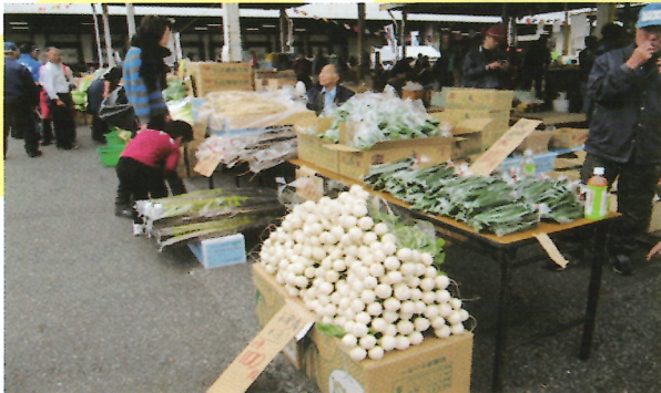
・特別価格で販売します。野菜・果物の模擬セリ