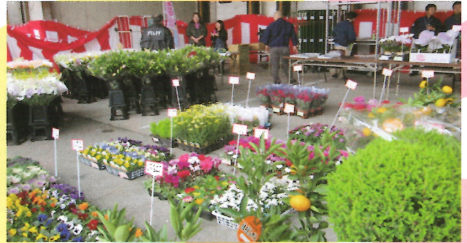
・切花・鉢物を特別価格で販売します。